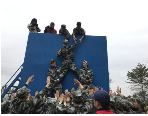
大学生户外拓展训练